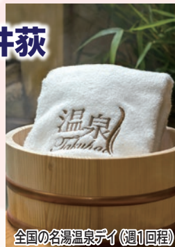
全国の名湯温泉デイ(週1回程)