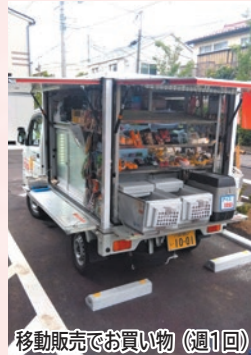
移動販売でお買い物(週1回)