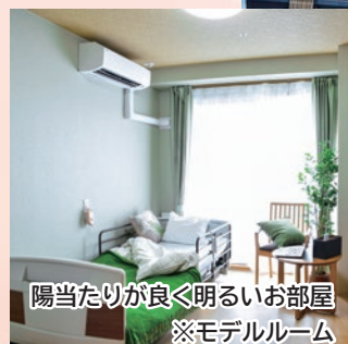
陽当たりが良く明るなお部屋 ※モデルルーム