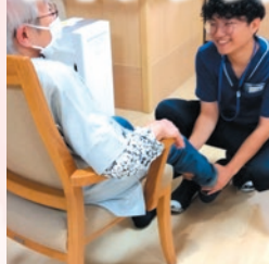
国家資格者の機能訓練