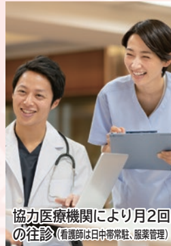
協力医療機関により月2回の往診(看護師は日中常駐、服薬管理)