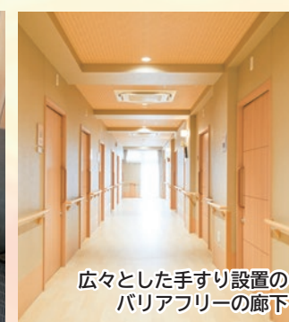
広々とした手すり設置の バリアフリーの廊下