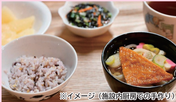
※イメージ（施設内厨房での手作り）