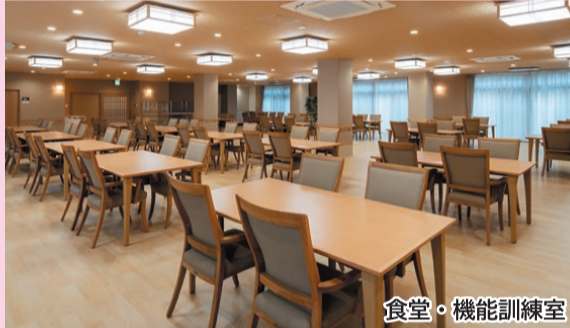
食堂・機能訓練室