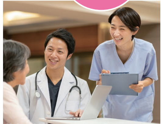
協力医療機関による月2回往診