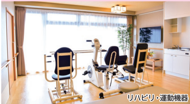
リハビリ・運動機器