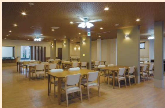
【食堂兼機能訓練室】