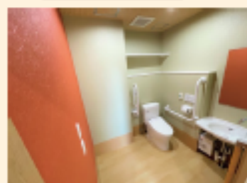
【バリアフリートイレ】