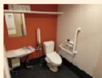
【バリアフリースイール】