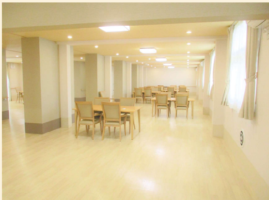
【食堂兼機能訓練室】