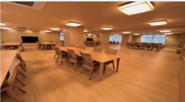
【食堂兼機能訓練室】