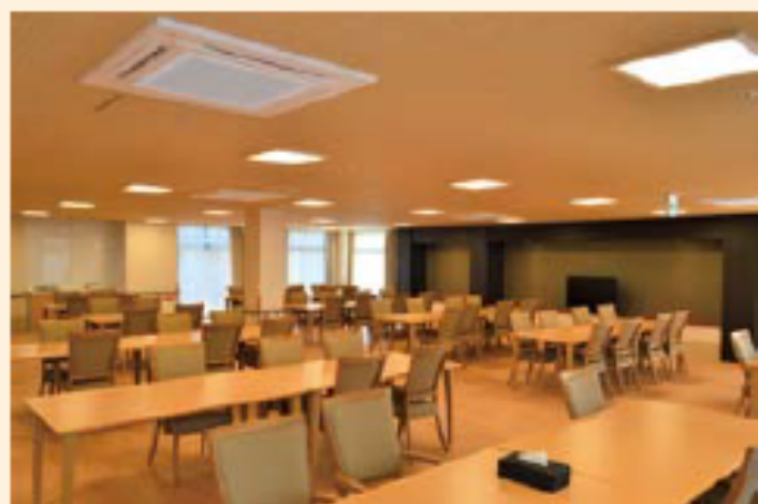
【食堂 兼 機能訓練室】