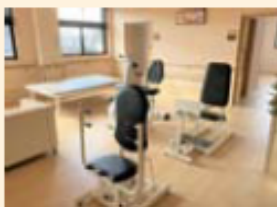
【機能訓練スペース】