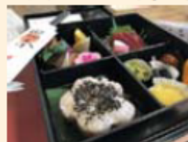
行事食のイメージです。