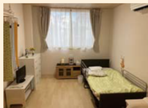
【居室】モデルルーム

※居室は、エアコン・収納・照明・ナースコールが備え付けです。上の写真はモデルルームになり、上記の備え付け以外は、イメージになります。