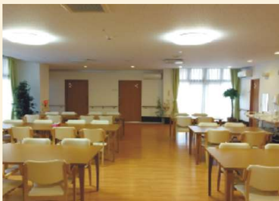
【食堂兼機能訓練室】