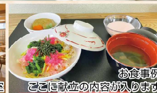
お食事例 ここに献立の内容が入ります