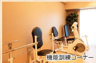
機能訓練コーナー