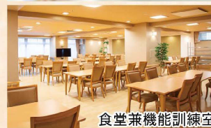
食堂兼機能訓練室