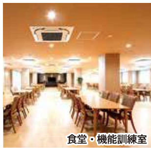
食堂・機能訓練室