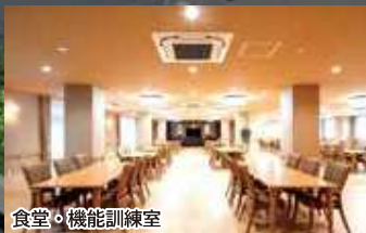
食堂・機能訓練室