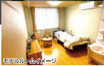
モデルルームイメージ