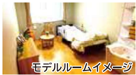
モデルルームイメージ